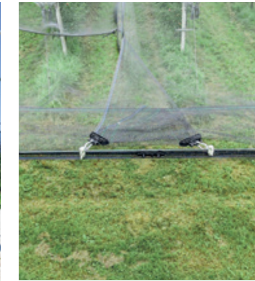
Gerader Abschluss und schräger Abschluss jeweils mit idealer Bungyentleerung