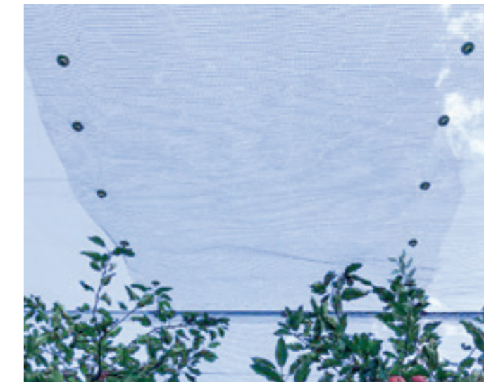
Das Netz für Fahrgassenüberdachung wird am bestehenden Netz mit Stechclips befestigt.