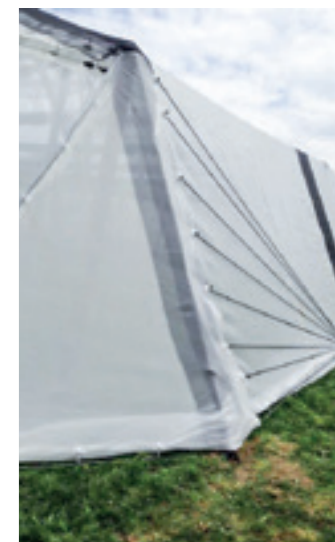
Mit Insektennetz auch Suzukidicht