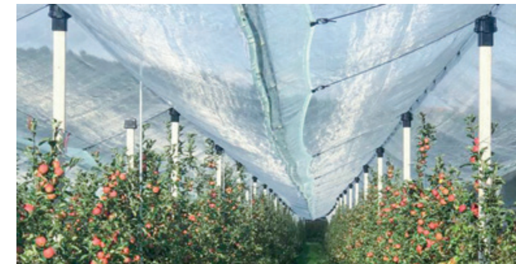
Ein zusätzlich montierter Netzstreifen in der Traufe bietet einen idealen Streuschadenschutz und macht die Traufe dicht.